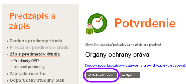
Obr. 5: Kontroly pred podaním požiadavky na zápis predmetu

Kliknite na tlačidlo Potvrdiť zápis . Ak ste zistili, že podávate omylom požiadavku na predmety, ktorú ste podať nechceli, kliknite na tlačidlo Späť. Už podané požiadavky sa dajú zrušiť.