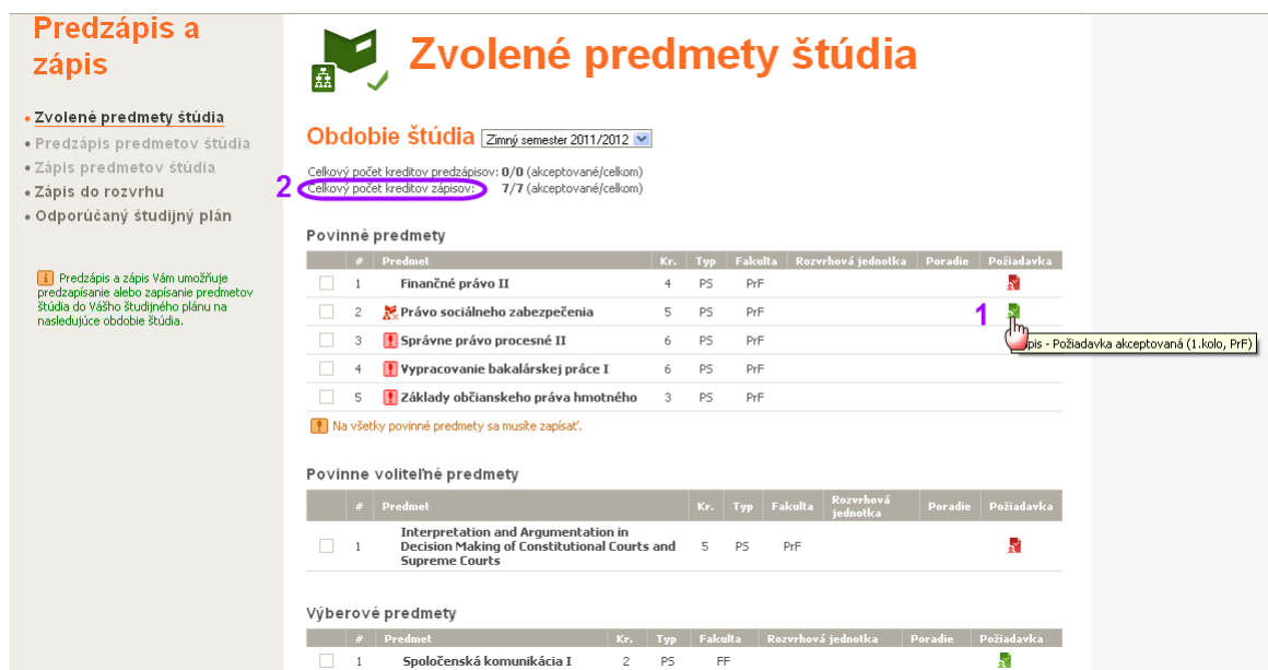
Obr. 9: Stav požiadavky po uzavretí kola zápisu

Po uzavretí kola si v obrazovke Zvolené predmety štúdia môžete skontrolovať, ktoré vaše požiadavky boli schválené alebo zamietnuté (obr. 9 - 1). Sledujte Celkový počet kreditov zápisov (obr. 9 - 2) a v prípade potreby sa v ďalšom kole zápisu zapíšte na iné ponúknuté predmety.