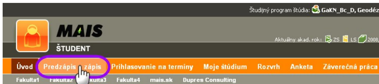
Obr. 3: Menu predzápis a zápis